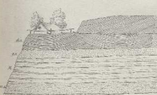
SSW. C. Höhe der Ausgrabung - 18 Met. NNO

1. Sand d. d. Schieferung, weiß, gelblich grau, transversal geschichtet. g. Gelblich-grober glimmerreicher Sand (Mergel) bei M. Mergel. M. Mergel bei M. Mergel. n. d. Schieferung, weiß, gelblich grau, transversal geschichtet.