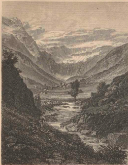
CIRQUE DE DAVARNIE.