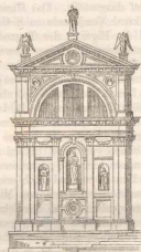
S. Maria della Salute. Kapellenfascade.