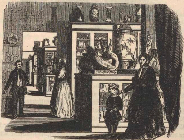
Das Museum der Porzellanmanufactur in Sèvres.