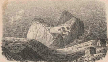
Die verlassene Stadt Skiathos.