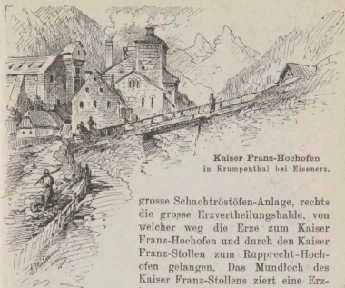
Kaiser Franz-Hochofen in Krumpenthal bei Eisenerz.

grosse Schachtröstöfen-Anlage, rechts die grosse Erzvertheilungshalde, von welcher weg die Erze zum Kaiser Franz-Hochofen und durch den Kaiser Franz-Stollen zum Rupprecht-Hochofen gelangen. Das Mundloch des Kaiser Franz-Stollens zielt eine Erzbüste dieses Monarchen.