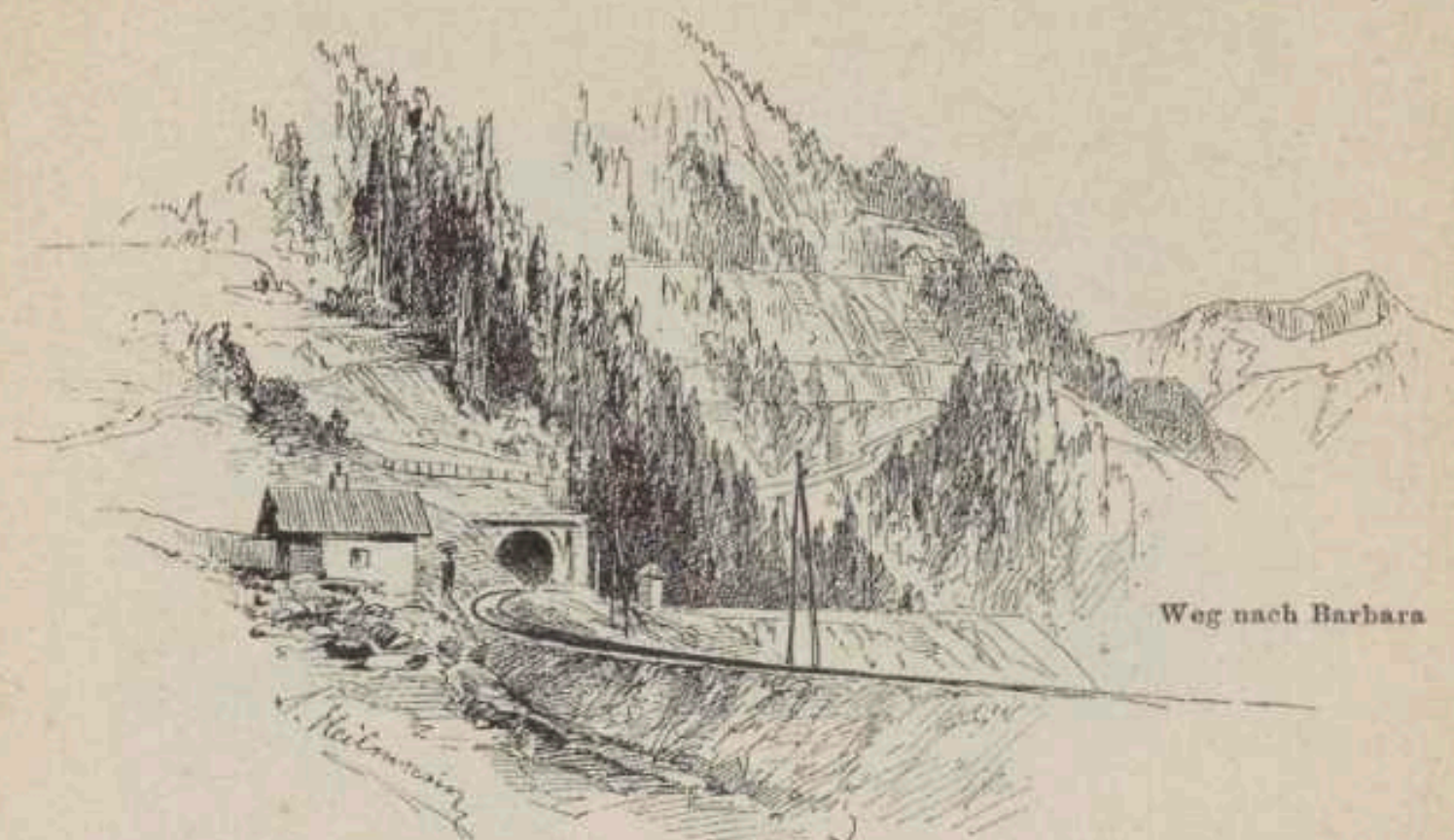
Platten-Tunnel-Mundloch (1100 Meter ü. d. M.) auf der Feisterwiese.

durch tiefe Einschnitte und über hohe Anschüttungen zu dem 20 Meter hohen Sauerbrunngraben-Viaduct (8 Oeffnungen) und von da fort am Gehänge des Kressenberges*) sich hinziehend, an